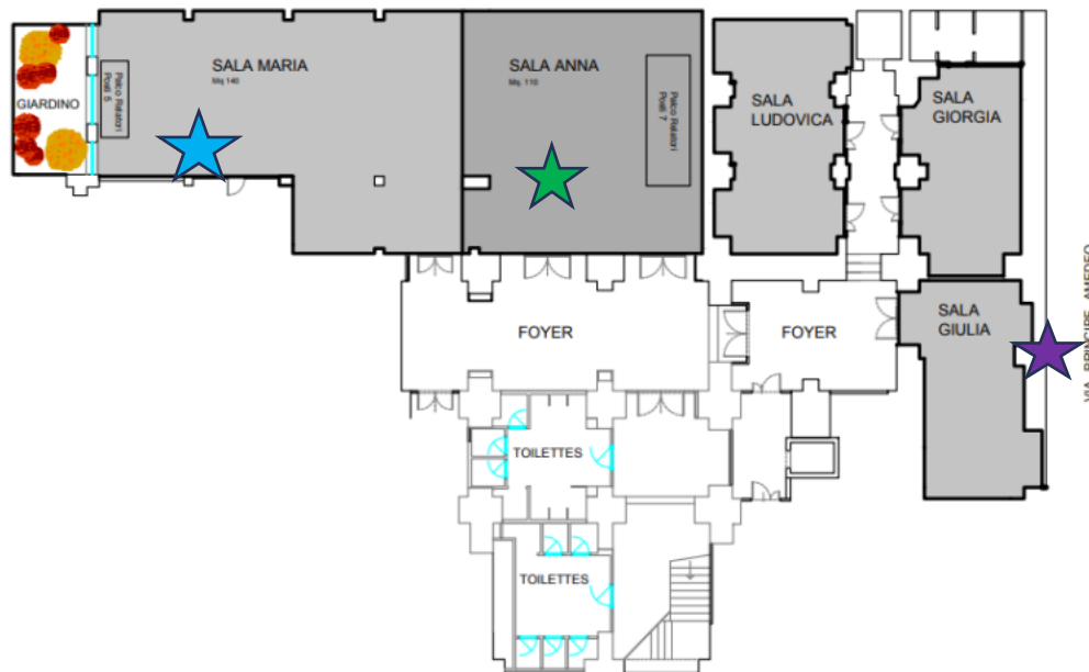
Planimetria Seminterrato/ Basement Conference Plan